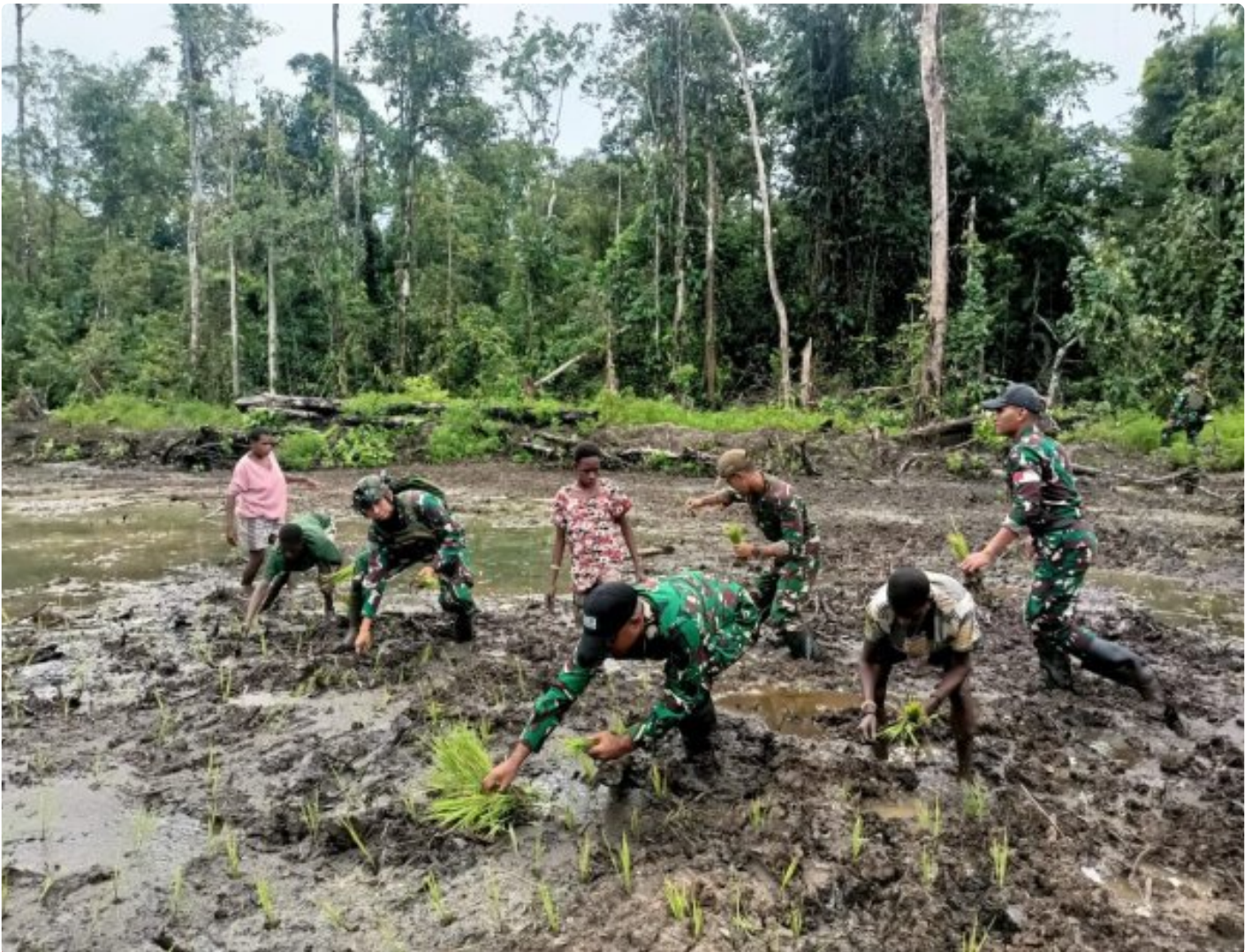
Foto: Satgas Pamtas Mobile RI-PNG Yonif 503/Mayangkara menggagas program ketahanan pangan yang melibatkan langsung warga Kampung Mumugu, Distrik Krepkuri, Kabupaten Nduga, Selasa (07/01/2025).

NDUGA- Dalam upaya membangun kesejahteraan masyarakat di wilayah