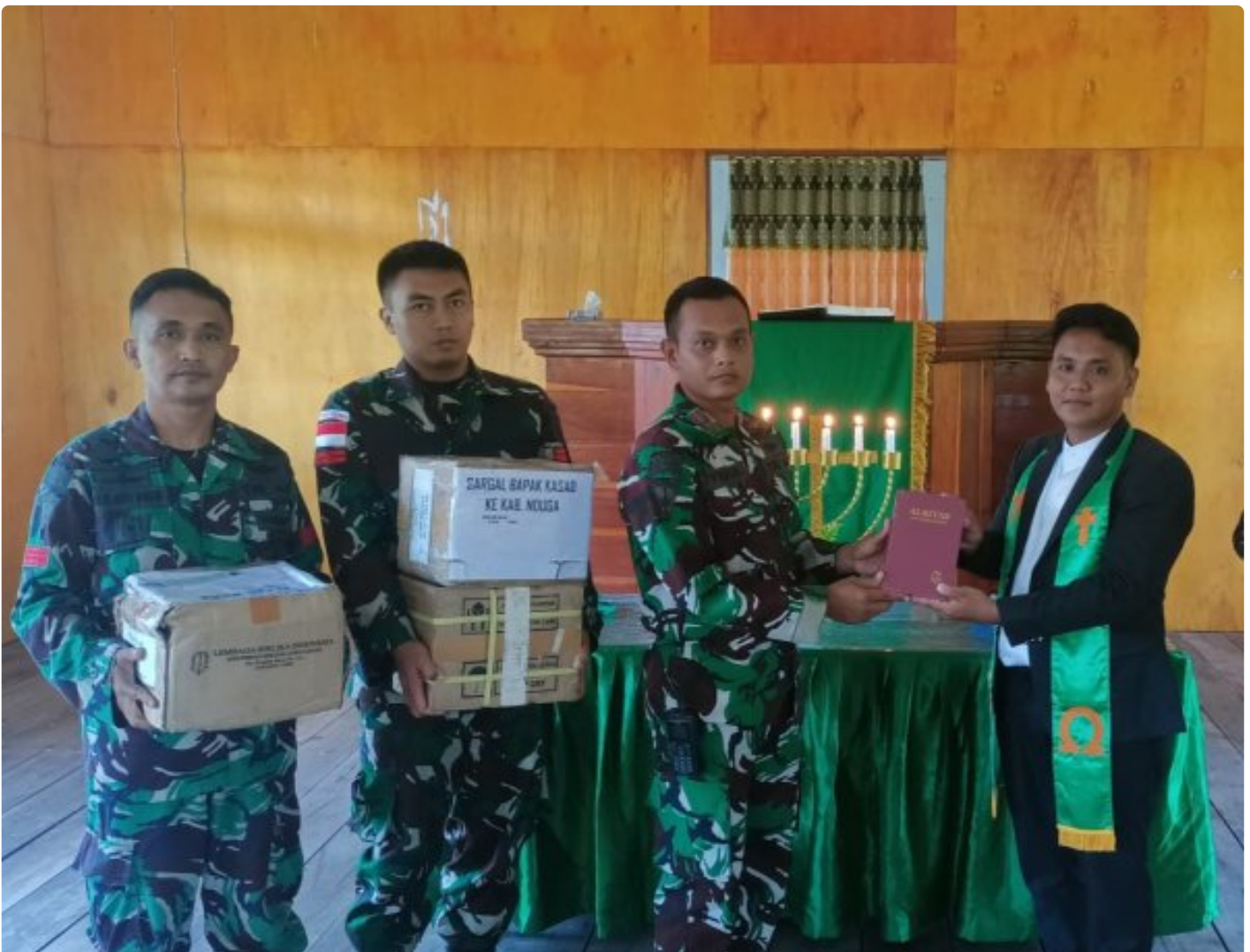
Foto: Satgas Yonif 503/Mayangkara kembali menunjukkan dedikasinya kepada masyarakat di Papua dengan memberikan dukungan alat musik untuk kegiatan ibadah di Gereja GKI Bethesda Batas Batu, Distrik Krepkuri, Kabupaten Nduga. Pada Minggu, 12 Januari 2025.